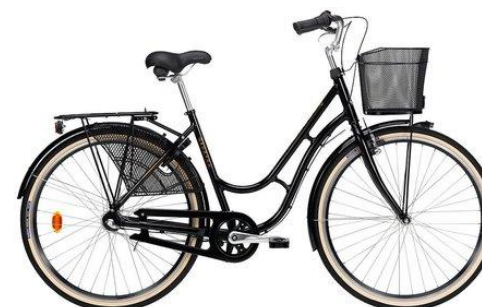
Monark Karin 3-vxl