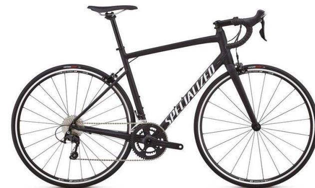
Landsvägscyklisten: Specialized Allez Elite

Nettokostnad vid 33% marginals katt per månad för medarbetaren: 388kr