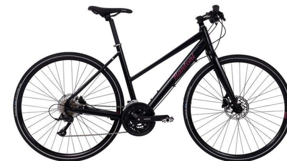
Bantoni Andio Dam