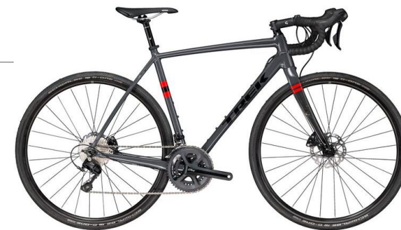
Trek Checkpoint ALR 5

Vill jobba för egen maskin utan att nödvändigtvis se ut som en tävlingscyklist. Finns med både rakt styre (hybrid) och bockstyre (gravel bike).