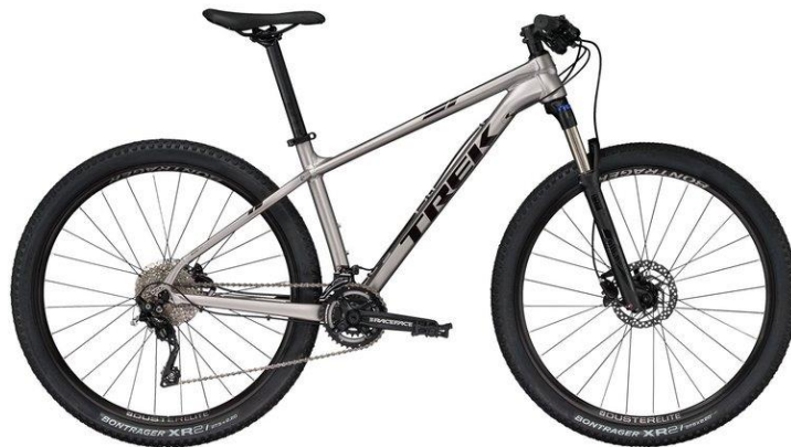
Trek X-Caliber 8 Herr Nettokostnad: 207 kr/mån*

Underlaget får inte vara något hinder. De här cyklarna trivs bäst i skogen men rullar lätt oavsett vägval. Välj SPD-pedal eller platt för säkrare pendling i stan.