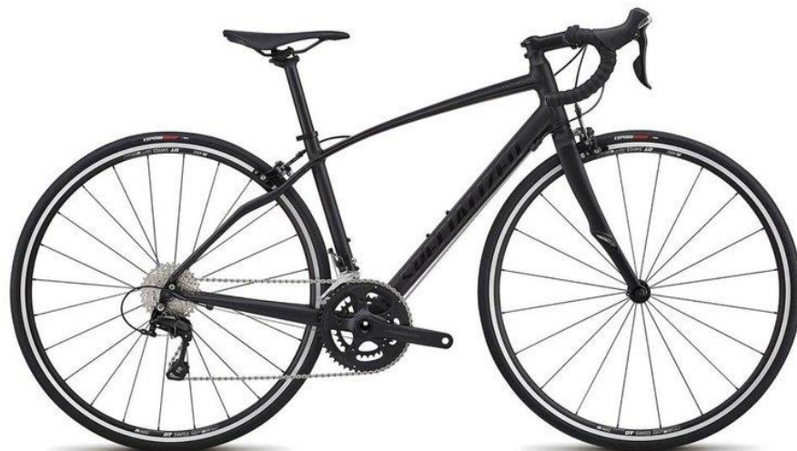
Specialized Dolce Elite

Lite vassare, lite dyrare men ack så eftertraktansvärda. Här kan man inte längre skylla på cykeln. Ut på landsvägen för egen kraft. Kanske Vätternrundan?