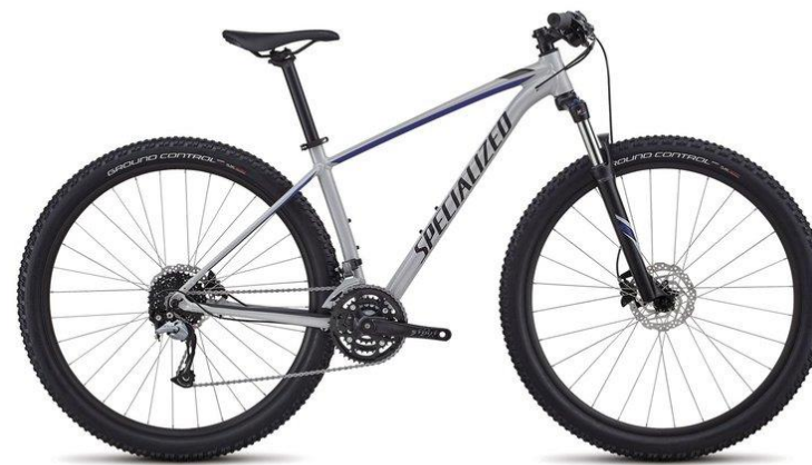
Specialized Rockhopper Comp Dam Nettokostnad: 169 kr/mån*

*osubventionerat samt 33% marginals katt