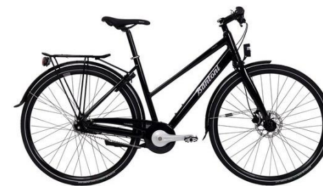
Bantoni Flavio Herr resp. Dam

Tillbakalutad i lugnt tempo. Matlådan i korgen på styret. Klassikern får dig att må gott och ta det lugnt. Finns med både lågt och högt insteg. Bra för en tur till affären, en lagom sträcka till jobbet. Levereras 7-växlad eller 3-växlad med säkerhetspaket. Kanske komplettera med en Hövding i stället för vanlig hjälm?