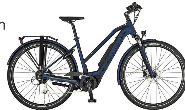
Elpendlaren: Scott Sub Tour Eride