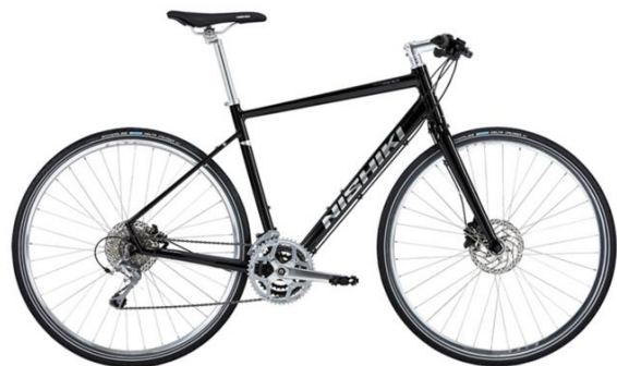
Nishiki Pro SLD Herr