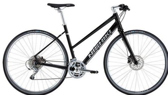
Nishiki Pro SLD Dam